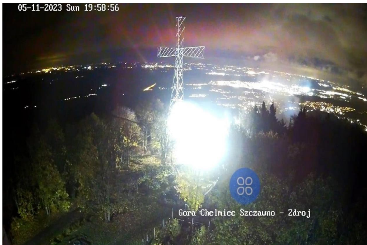
Zorza polarna widoczna z Góry Chełmiec