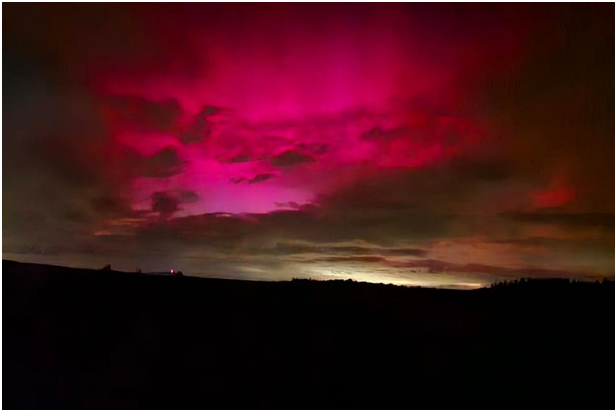
Zorza polarna nad Dolnym Śląskiem,

wykorzystywania projektu, który przez swych badaczy jest uznawany za cywilny, mimo iż w badaniach nad nim uczestniczą Siły Powietrzne i Marynarka Wojenna Stanów Zjednoczonych. Istnieje obawa, że urządzenie może zostać wykorzystane w przyszłości w celach militarnych, jako broń XXI wieku. Jednocześnie ukazane zostają inne możliwości zastosowania wytwarzanych fal elektromagnetycznych, m.in. do ingerowania w poszczególne warstwy atmosfery, prześwietlania ziemi czy zakłócania komunikacji radiowej, a także negatywny wpływ tych działań na ludzi i ich otoczenie.