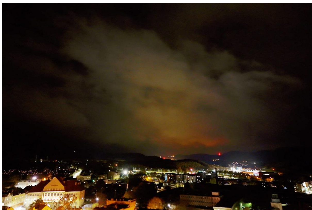
Zorza polarna nad Wałbrzychem